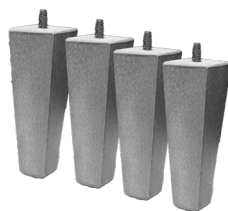
4 Pés de Madeira